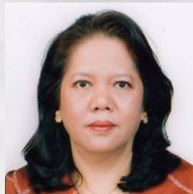
Princesse Norodom Veasna Diva Sirivudh