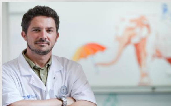
Le Professeur Raphaël VIALLE

Il est aussi l'auteur de nombreuses publications nationales et internationales