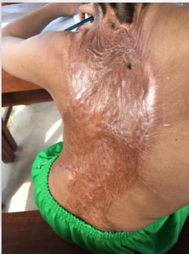
La peau s'est nécrosée, et n'a pas pu s'étendre