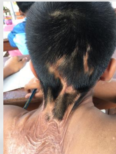
Des 'cordes' de chair retiennent la tête au cou